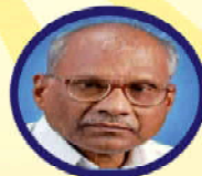
ఆత్మీయ అతిథి డా. కార్తీక్ ఖరలాచార్య స్వాతంత్ర్య సమరయోధులు