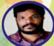
అత్యయ అతిథి డా. జి. అనంజన రావు తెలుగుశాఖాధిపతి, ఆంధ్రవిశ్వవిద్యాలయం విశాఖపట్నం.